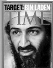
オサマ・ビンラディン アルカイダのリーダー