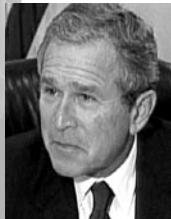
ジョージ・W・ブッシュ 第43代米国大統領